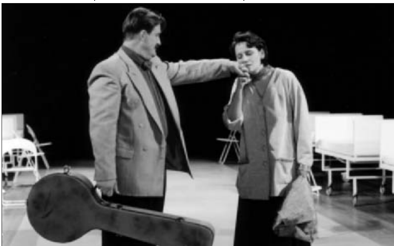
Am Mittwoch, dem 21. Januar, 19.30 Uhr, ist Arthur Millers „Der letzte Yankee“ (Foto) in der Regie von Peter Sodann zum vorletzten Mal im neuen theater in einer 4-Euro-Vorstellung zu sehen. Am Sonnabend, dem 14. Februar, starten die Schauspieler und einige nt-Mitarbeiter unter Sodanns Leitung gen Osten und spielen das Stück im Jermolowa-Theater in Moskau. Unterstützt und gefördert wurde die Reise vom Regierungspräsidium Halle und dem Goethe-Institut.