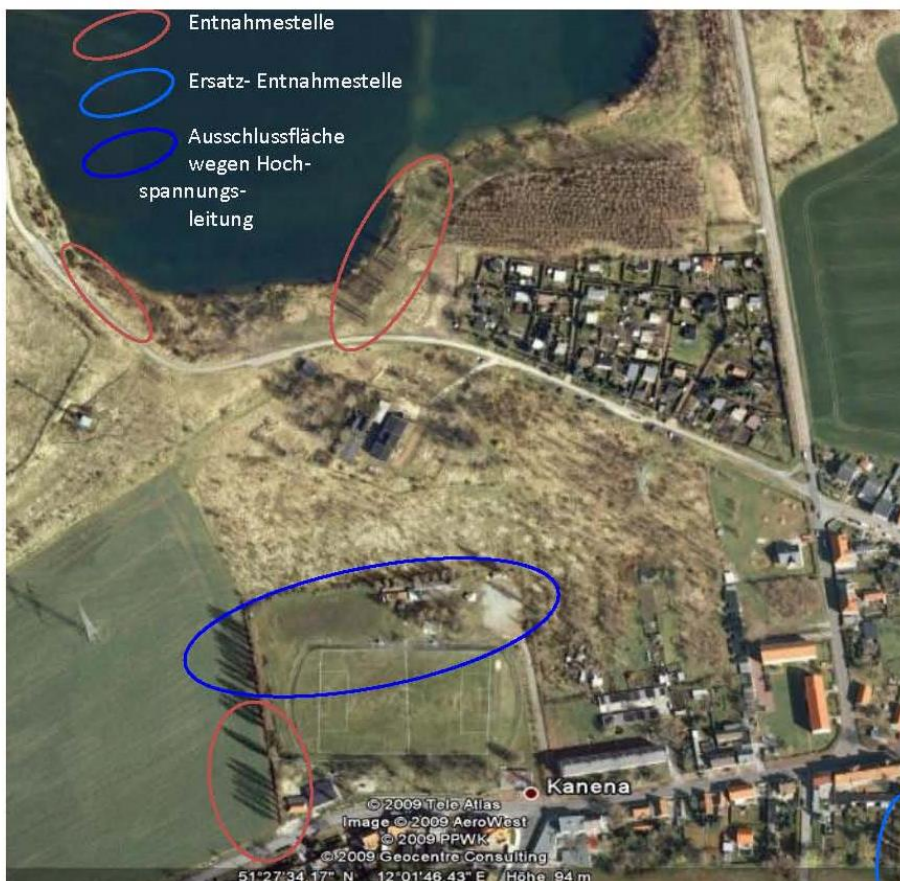
Abb. 2: Probenahme Pyramidenpappeln

Entscheidend ist dabei die langfristige Vergleichbarkeit der Proben, die auch am Hufeisensee erhalten bleiben sollte. Deshalb ist der Erhalt dieser Pappeln zu sichern (vgl. Abb. 2 sowie Planzeichnung).