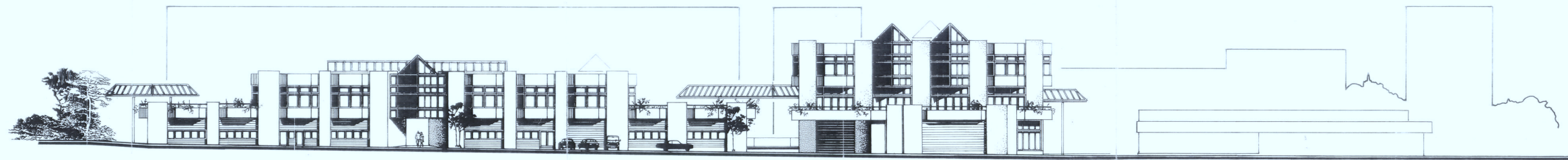
ANSICHT VOM HEIDERING