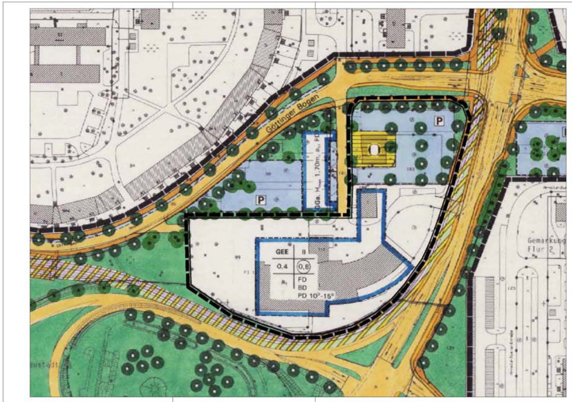
Abb. 1: Ausschnitt aus dem rechtsverbindlichen Bebauungsplan Nr. 90 mit Markierung des Änderungsbereiches