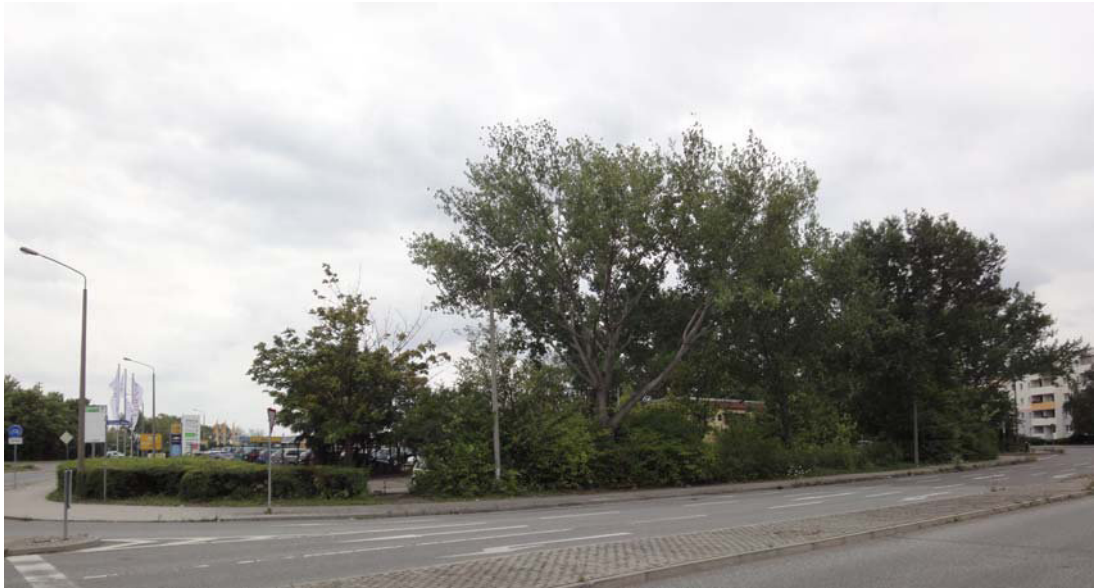
Abb. 2: Blick von der Ecke Göttinger Bogen / Weststraße auf den Gehölzbestand des nördlichen Änderungsbereiches (planerzirkel, Juli 2011)

Die Bauflächen im Änderungsbereich sind im Süden mit dem Gebäude des Autohauses Mundt bebaut sowie nordöstlich davon mit einem Einzelgebäude auf dem Flurstück 100, das zurzeit als Lager dient. Im Nordwesten ist eine Fernwärmestation vorhanden.