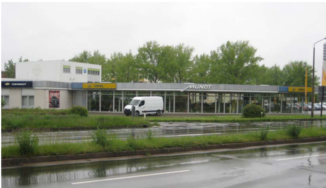
Abb. 3: Blick von Südosten (Weststraße) auf das Autohaus Mundt (planerzirkel, Mai 2010)